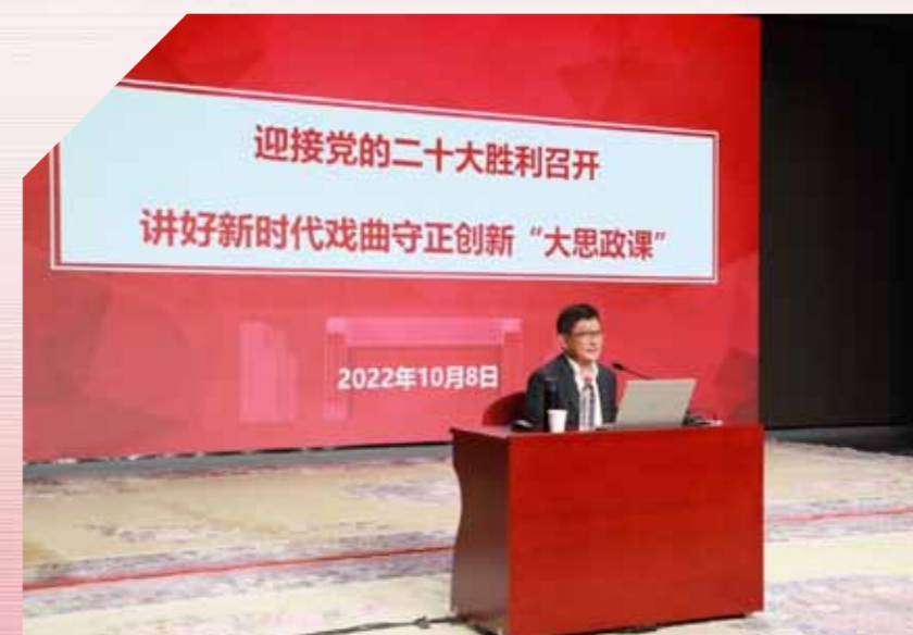
文:马克思主义学院 图:党委宣传部

中国戏曲学院音乐系、京剧系部分师生、青年马克思主义者培训工程培训学员在现场聆听了讲座,2000余名师生线上同步收听收看讲座。