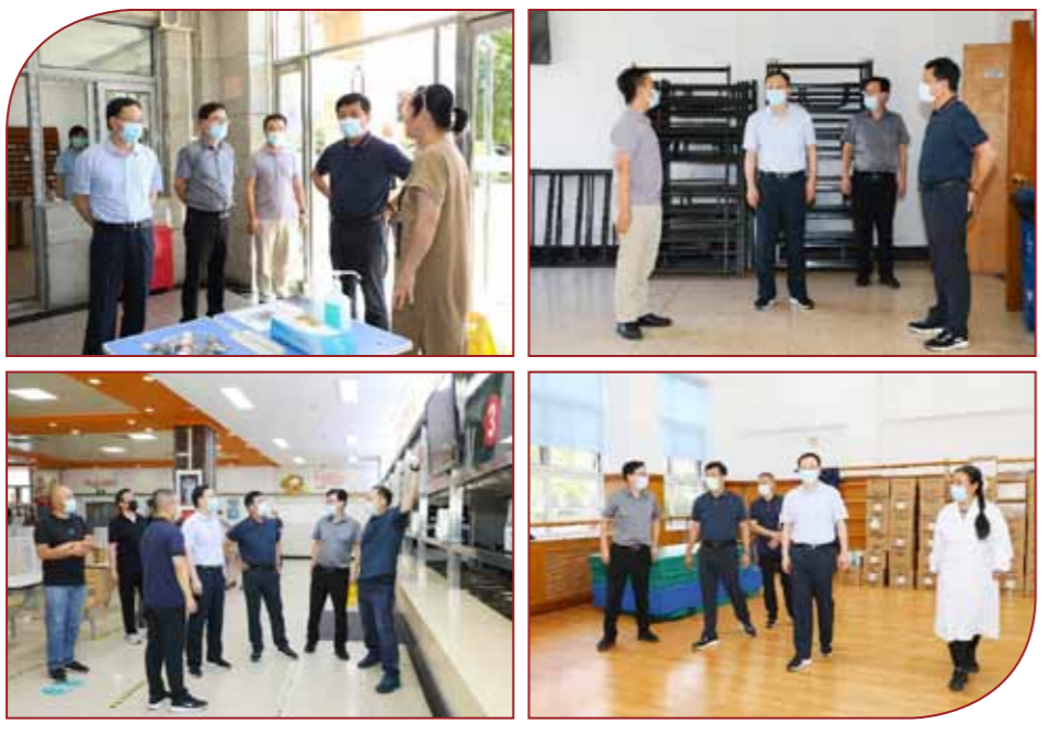
文:保卫处