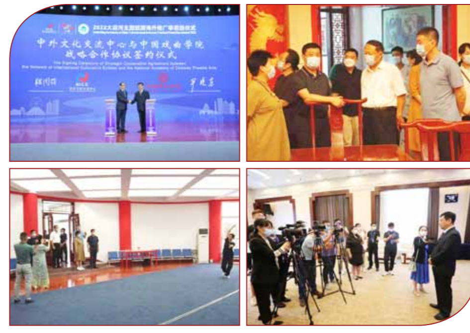
文:国际交流合作部