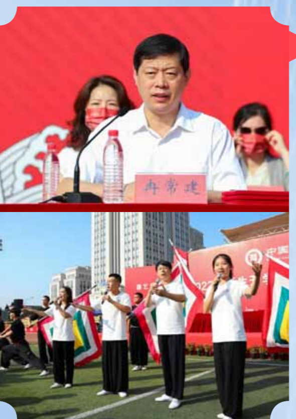
尹晓东指出，时代各有不同，青春一脉相承。希望同学们珍惜在国戏的学习时光，勤学苦练，砥砺品格，练就本领，“立大志、明大德、成大才、担大任”，用青春的力量推动戏曲艺术传承发展，在实现民族复兴的伟大实践中放飞青春梦想，书写人生华章。