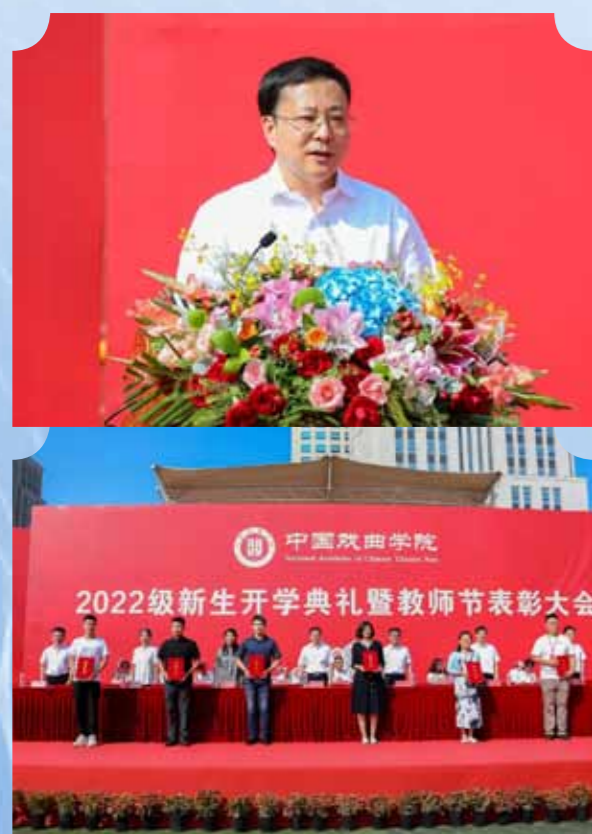
九月金秋如约而至，国戏学子逐梦而来。9月16日上午，中国戏曲学院2022级新生开学典礼暨教师节表彰大会在学院操场隆重举行。