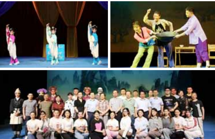
文:表演系 图:表演系