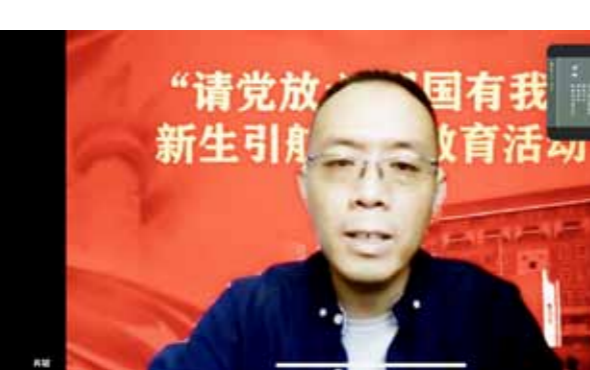
为帮助2022级新生提高心理健康与心理保健意识，提升心理适应能力，建立积极心态。9月1日下午，我院邀请到中国心理大学心理健康教育中心主任、中国心理学注册督导师、中国心理学会心理危机干预委员会委员肖斌老师做线上心理健康教育讲座。讲座以“青春无限勇敢出发”为主题，是我院“请党放心 强国有我”新生引航主题教育系列活动重要内容之一。

肖斌老师用《丑奴儿·书博山道中壁》《江雪》《酬乐天扬州初逢席上见赠》《七律·长征》等多首经典古诗词串起本场讲座的全部内容，以“趣味”“互动”“暖聊”“自来”“破冰”等主题深入浅出地为同学们介绍心理健康知识。大学是人生重要的启航阶段，同学们需要充实和丰富人生体验，允许自己有失败和遗憾，经历深入认识自我、认可自我价值的过程。最终建立牢固的自我同一性，实现更好的心理成长。肖斌老师用平实幽默的语言为同学们讲述了通透的人生道理，同时引导同学们在有需要的时候积极向学院大学生心理咨询中心、校外专业心理咨询机构、社会公益资源等求助，及时化解心理危机。