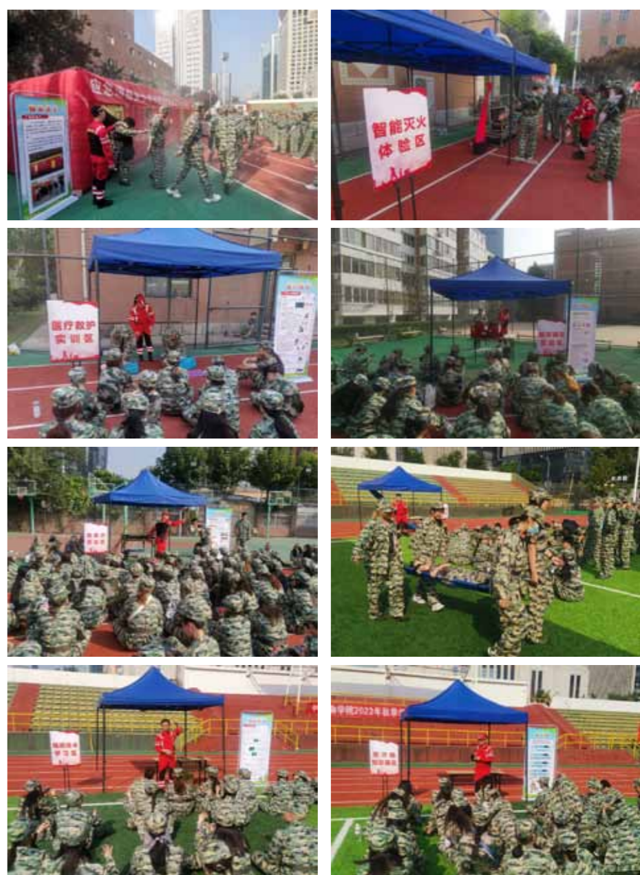
文：保卫处

开展此次培训演练活动是深入贯彻落实《北京市单位消防安全主体责任规定》的一项具体举措，进一步增强了学院师生的应急消防安全意识，提高了防范火灾、安全逃生、自救互救以及应急组织的能力，为确保学院安全形势持续稳定奠定了基础。