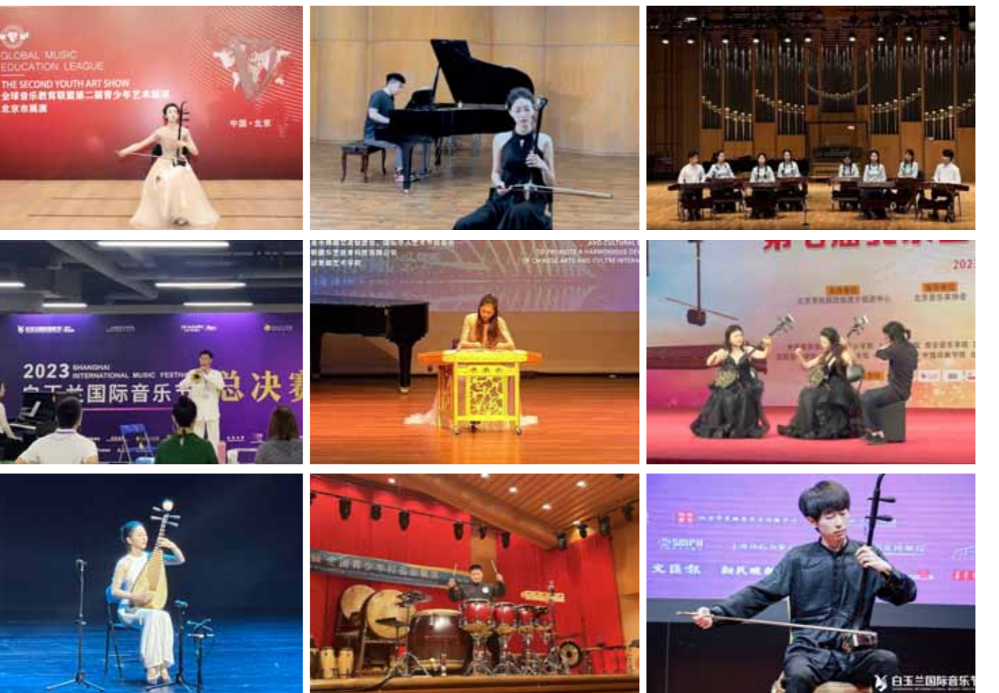
文：音乐系 图：音乐系

辛勤结硕果，青春谱华章。暑假期间，学院音乐系民族器乐专业多名学生在国内外专业赛事和展演活动中喜获佳绩，多名教师获得优秀指导教师等荣誉称号。充分展示了音乐系人才培养的丰硕成果，为建设一流专业起到了促进作用。音乐系将继续以习近平总书记重要回信精神为根本遵循，聚焦人才培养，突出专业特色，发挥行业优势，不断提高教学质量，提升社会竞争力，努力培养出更多德艺双馨的戏曲音乐人才。