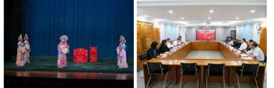
文：院办公室