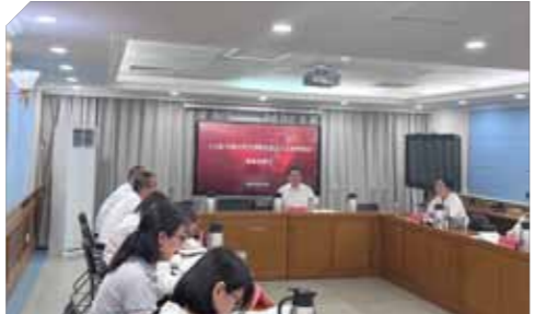
文：思政部 图：思政部

关系，树立正确的世界观、人生观和价值观。三要得法。坚持理论联系实际，贯通学校小课堂和社会大课堂，结合不同专业学生情况，运用“戏曲+思政”、集体备课、案例研讨、实践教学等多种形式，提高思政课的课堂教学质量和育人效果。四要入心。思政课重在入脑入心，思政课教师要高标准抓好理论学习，带着责任言传身教，用真情实感讲好每一堂课，严格课堂管理，加强互动交流，不断增进学生对党的创新理论的政治认同、思想认同、理论认同、情感认同。