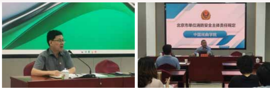
文：保卫处

导干部要真正成为贯彻落实《规定》的“明白人”和“先行者”，做到知责明责、守法尽责。二是要持续推进“安全生产和火灾隐患排查大整治”，各单位、部门要对所管理的场所加强消防安全隐患排查，对发现的问题做好整改，确保整治效果，坚决消除安全隐患。三是要确保工作成效，各单位、部门要结合实际，通过不同途径、多种方式，广泛动员，确保宣讲活动全覆盖，筑牢消防安全基础，不断增强师生落实消防安全主体责任的行动自觉。