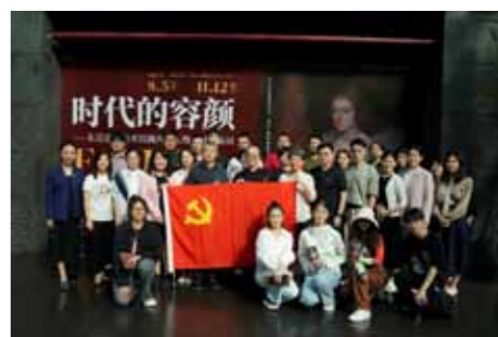
文：舞台美术系 图：舞台美术系

此次，观摩学习师生受益匪浅，表示将深入学习贯彻习近平新时代中国特色社会主义思想，自觉承担起举旗帜、聚民心、兴文化、展形象的使命任务，坚持以人民为中心的创作导向，坚持创造性转化、创新性发展，以传世之心打造传世之作，努力攀登艺术高峰，不断创作生产更多的优秀作品，助力文化强国建设。