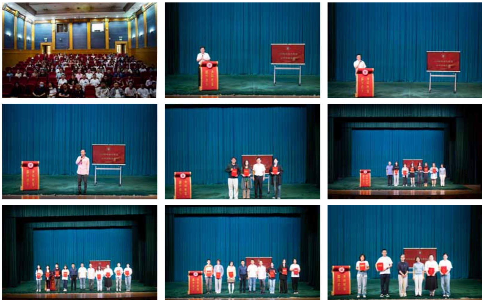
文：戏文系

会议对“专业能力考核”“暑期社会实践优秀成果”“暑期社会实践成果”“国防知识竞赛小组”以及“挑战杯小组”这五个项目进行表彰。