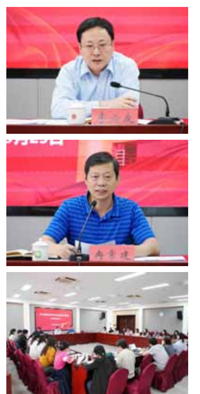
文：科研处

会上，各课题组负责人就专项课题研究的选题、意义、方向、安排等作了交流发言。大家表示，在学院党委的高度重视和直接推动下，坚信专项课题研究会结出硕果。