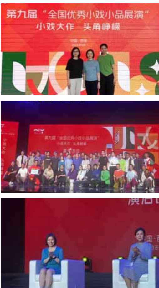
文：戏文系 图：戏文系

见微而知著、浓缩与淬炼、与时代同频、与人民共情，呈现社会百态，讲好中国故事。第九届全国优秀小戏小品展演是一次全国小戏小品创作成果的集中展示，对戏文系师生来说是一次良好的艺术实践学习，进一步促进了戏文系人才培养质量提升工作，为小戏小品创作教学积累了实践教研经验，也为戏文系课程思政示范课建设的发展提供了新的思路。