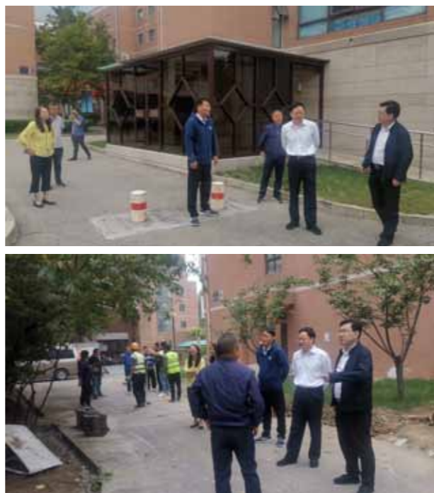
文：保卫处

学院保卫处、学生工作部、教务处、图书馆、艺术实践管理中心、后勤管理中心等职能部门负责人和有关人员参加检查。