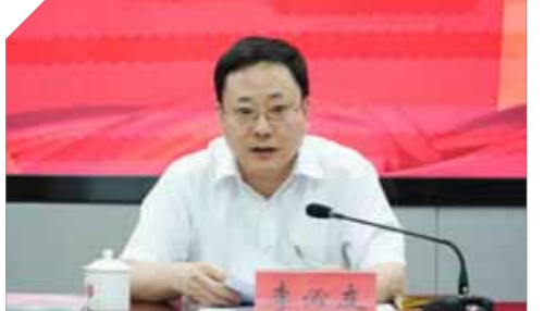
文：党委组织部 图：党委宣传部

三是自觉强化担当作为，更好服务发展大局。发挥示范带动作用，加强能力建设，提升专业素养，主动担责、真抓实干、齐抓共管，提高戏曲人才培养质量，更好服务国家重大需求和新时代首都发展。四是自觉履行主体责任，纵深推进管党治校。加强党风廉政建设，抓实以学正风，营造干事创业、风清气正的育人环境，推动党建工作与戏曲教育事业深度融合，不断提升管党治校办学水平，办好人民满意的戏曲教育，努力担负起新时代新的文化使命。