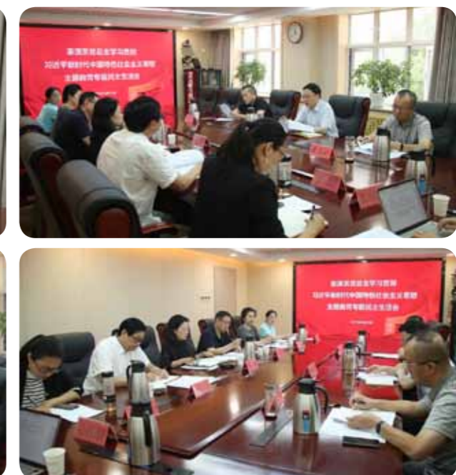
文：表演系