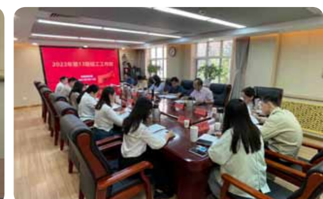
文：党委组织部 图：党委组织部