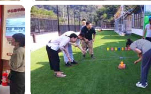
文：人事处